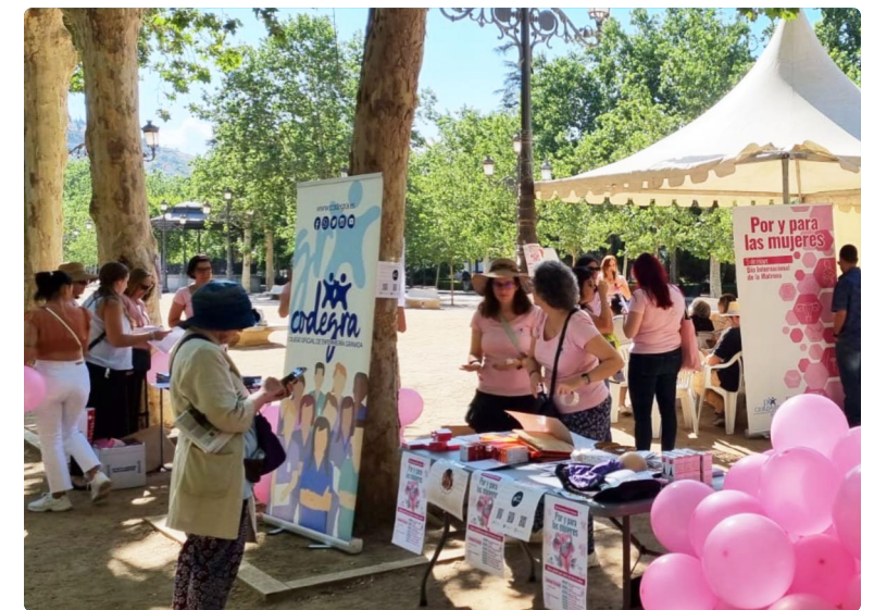
Por y Para las Mujeres en Granada