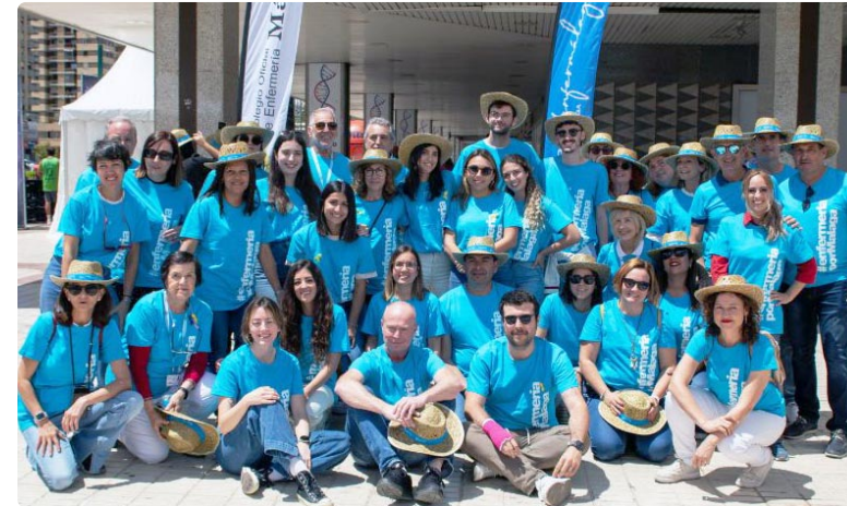
Profesionales sanitarios que participaron en la celebración del II Bazar del Cuidado

En la mesa del Colegio de Enfermería de Málaga/AMA se ofreció información relevante sobre la institución. En la mesa de “Una Matrona en tu vida”, se dio a conocer el papel de las matronas y su labor en la atención a la salud reproductiva y sexual de la mujer. En la carpa dedicada a “Enfermería Pediátrica para crecer seguro”, se profundizó en temas como la obesidad infantil y el sedentarismo en edades tempranas y la importancia de una enfermera espe-