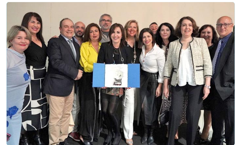
Celebración del Día Internacional de la Enfermería en el COEH

en salud, contribuyendo de manera significativa a la prevención, el diagnóstico, el tratamiento y el cuidado de las personas. “Este día representa una oportunidad única para mostrar al mundo que la Enfermería es una profesión vital en el cuidado de la salud, y que su labor diaria contribuye al bienestar y la calidad de vida de la sociedad en su conjunto. La dedicación y el compromiso de las enfermeras en su trabajo diario no solo se refleja en la atención a los pacientes, sino también en la mejora constante de