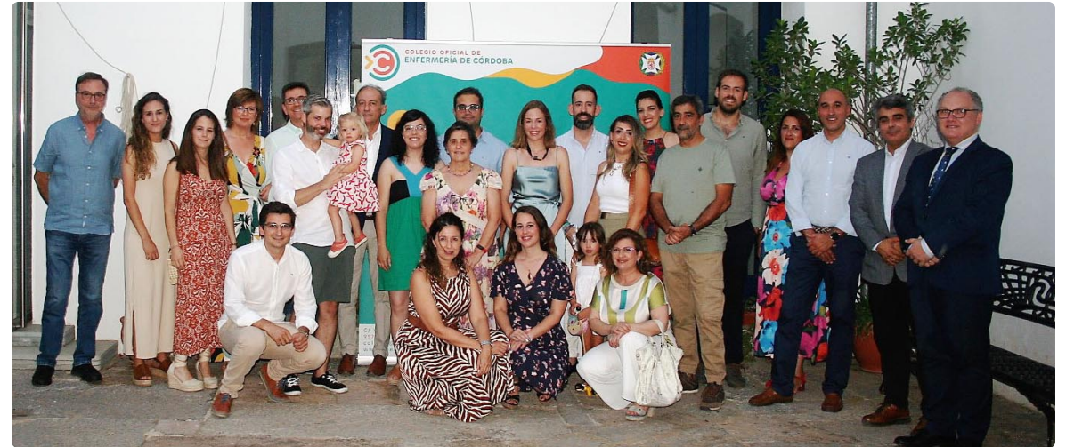
Foto de familia de los asistentes a este acto

EIR en el Reina Sofía, y en él se explican los principales cuidados postoperatorios prestados por el equipo de enfermeras de la UCI Pediátrica en una paciente intervenida de una cardiopatía compleja.