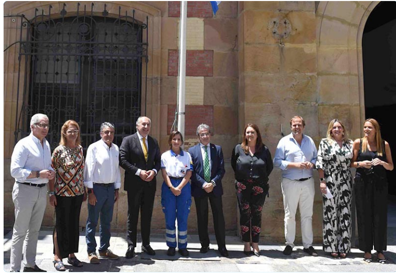
El presidente del Colegio, el alcalde y varios miembros de la corporación del Ayuntamiento de Algeciras