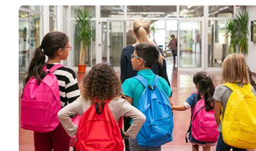
El rol de la enfermera escolar y el derecho a una educación igualitaria