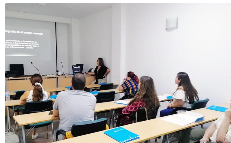
Enfermeras malagueñas asisten al curso "La ecografía en el acceso vascular"

Además, este curso no solo ha brindado a los participantes conocimientos y habilidades fundamentales en el área, sino que también se ha basado en la simulación como parte integral de la formación. A través de la simulación, los profesionales han tenido la oportunidad de practicar técnicas de canalización venosa utilizando la ecografía, lo que les ha permitido adquirir experiencia práctica en un entorno seguro y controlada. Como ha puesto en valor la docente del curso "esta metodología de enseñanza proporciona una oportunidad única de aprendizaje interactivo y fortalece la confianza de los participantes en la aplicación de estas habilidades en situaciones reales". ■