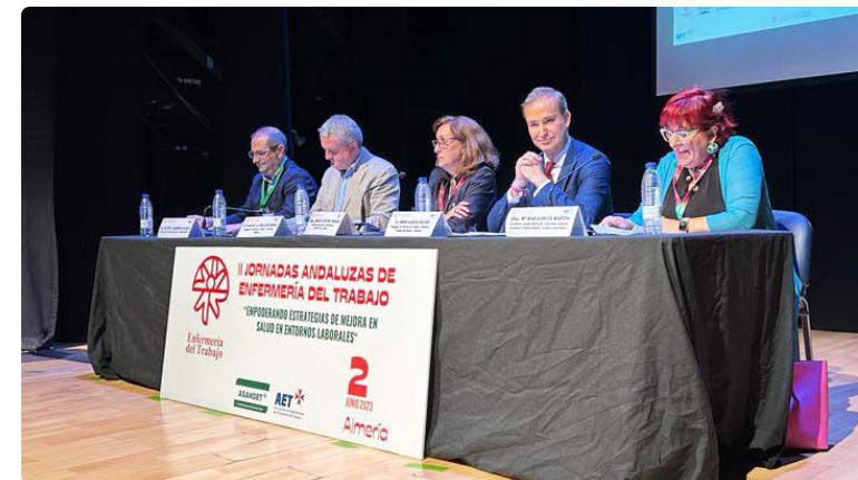
La mesa presidencial de las jornadas durante su inauguración

La enfermería del trabajo se enfoca en la promoción y el manteni-