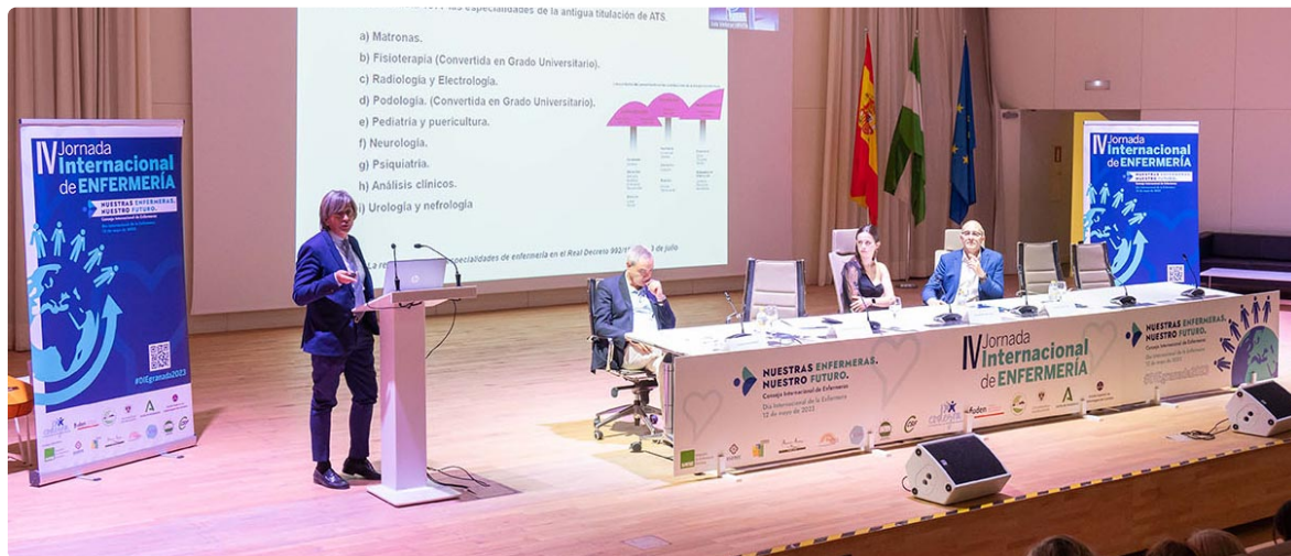
Granada reivindica el papel enfermero en avances de salud global

Granada celebró el Día Internacional de la Enfermera con un congreso también internacional dedicado a reivindicar el papel protagonista de estos profesionales en el camino para alcanzar la salud global