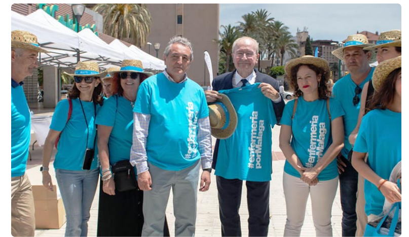
Francisco de la Torre, alcalde de Málaga, visita el II Bazar del Cuidado

Demostrar su compromiso con la promoción de la salud