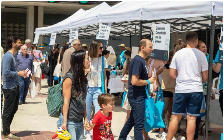
Instantánea tomada durante el desarrollo de la feria saludable

El II Bazar del Cuidado ha sido un éxito rotundo que ha permitido, un año más, reforzar la imagen de la Enfermería como un colectivo comprometido con el bienestar de la sociedad.