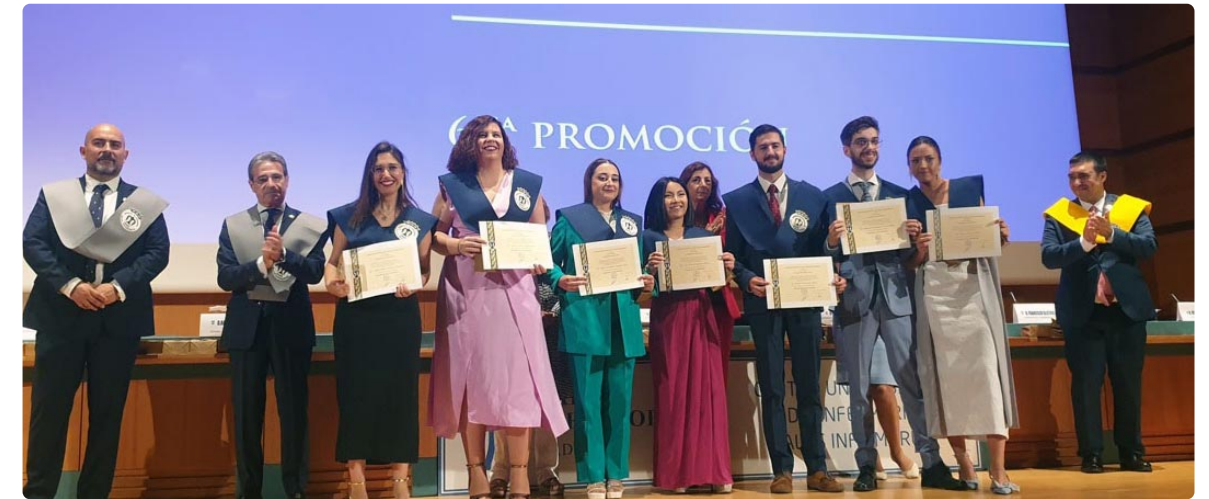
Graduación Centro Universitario de Enfermería Salus Infirmorum

El Colegio de Enfermería premió al 'Alumno más Destacado' de cada Facultad con la gratuidad de un curso de Experto Universitario en Cirugía Menor