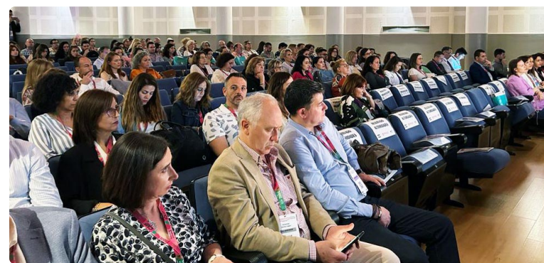
La mesa presidencial de las jornadas durante su inauguración

En resumen, la enfermería del trabajo desempeña un papel fundamental en la protección y promoción de la salud de los trabajadores. Estos profesionales son líderes en la implementación de estrategias de mejora en salud en entornos laborales, empoderando a los trabajadores y a las organizaciones para crear ambientes laborales seguros y saludables. Una labor totalmente fundamental dentro de la profesión enfermera. ■