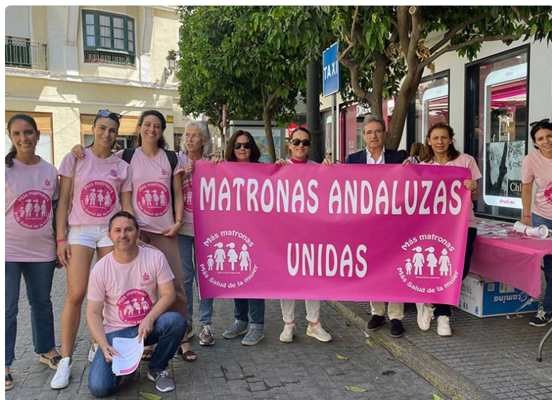
Las matronas recogiendo firmas en la Plaza del Palillero para reclamar más profesionales, en Cádiz