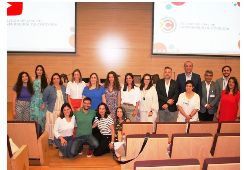
Foto de familia de las matronas participantes en el acto junto a miembros de la Ejecutiva del Colegio de Enfermería de Córdoba y responsables del Hospital San Juan de Dios

Por su parte, el Colegio de Enfermería de Granada celebró esta efeméride con talleres y charlas. El programa contó con propuestas para acercar la labor de las especialistas a la sociedad. Una vez más, este órgano colegial sumó la colaboración de la Asociación Andaluza de Matronas para "reivindicar el papel protagonista de las matronas con un programa enmarcado bajo el lema 'Por y para las mujeres'. Así, hasta el 7 de mayo, un grupo de especialistas dedicaron la jornada a talleres y charlas centradas en las embarazadas, una propuesta de actividades gratuitas para celebrar la profesión.