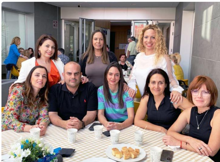
Miembros del equipo enfermero que han llevado a cabo los talleres de envejecimiento activo