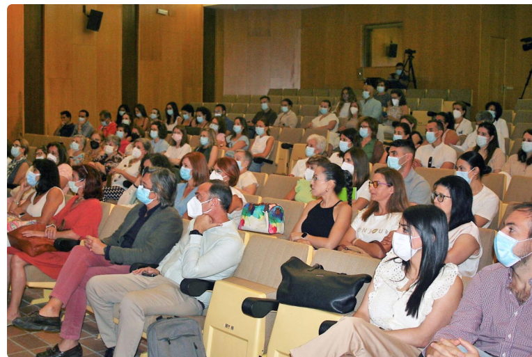
Detalle del público asistente

Durante este ‘Encuentro’ también se ha evidenciado la importancia de la figura de las enfermeras gestoras de casos de residencias de mayores puesta en marcha el pasado año desde Atención Primaria por el Servicio Andaluz de Salud (SAS), y de las propias enfermeras que trabajan en las 87 residencias (públicas, concertadas y privadas) que existen en la provincia, y que atienden directa-