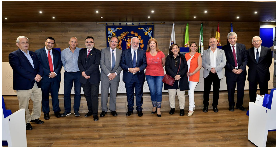
Miembros de la Junta de Gobierno del ICOEJ y ponentes de la Jornada de Historia

Estas Jornadas sobre Historia de la Enfermería en la Edad Moderna y Contemporánea se encuentran dentro de la intensa actividad formativa que lleva a cabo el Colegio de Enfermería a lo largo de todo el año, en la que participan miles de profesionales anualmente. ■