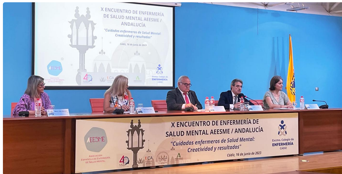
Mesa inaugural. - Desde la izda: la decana de la Facultad de Enfermería y Fisioterapia; la delegada de Salud y Consumo en Cádiz; el presidente de AEESME; el presidente del Colegio de Enfermería de Cádiz y la delegada de AEESME Andalucía