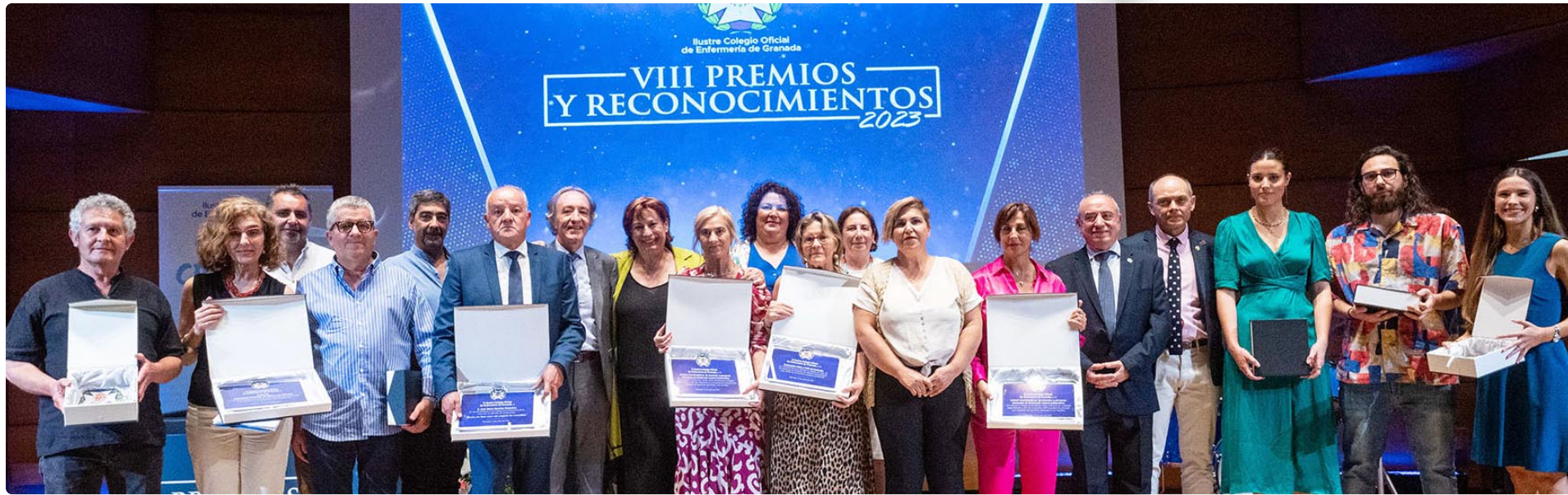
Foto de familia con los premiados de la VIII gala de Premios y Reconocimientos