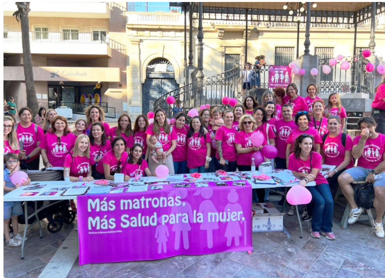
Celebración Día Internacional de las Matronas en Huelva