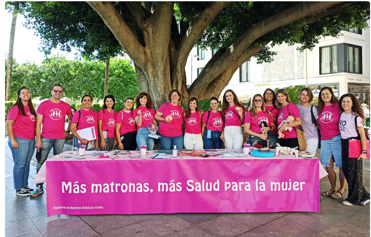
La 'Plataforma Matronas Andaluzas Unidas' en el centro de Sevilla