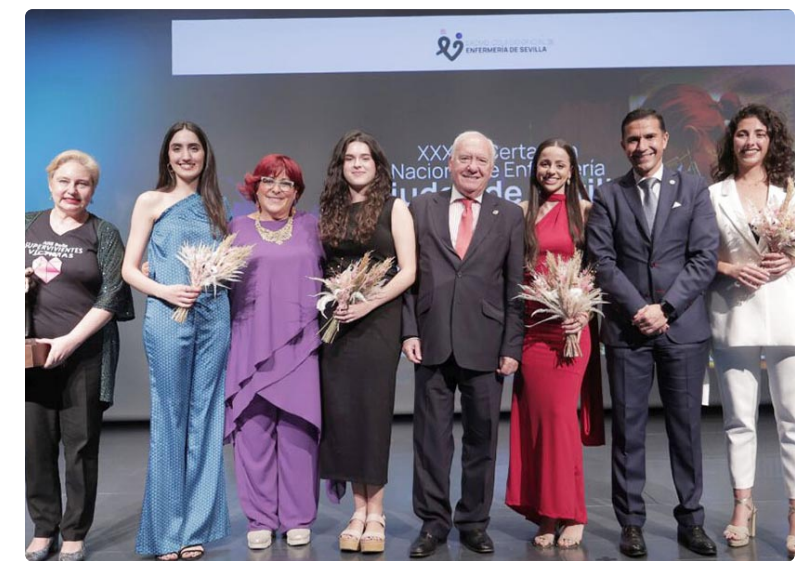
Premiados junto a representantes de las enfermeras sevillanas

La Fundación Ana Bella fue reconocida en la XXX edición del Premio San Juan de Dios, por su implicación con las mujeres maltratadas. Esta red de mujeres supervivientes actúa en 82 países como una solución global contra la violencia de género. Asimismo, aporta soluciones eficaces mediante la involucración de distintos agentes para actuar en el cambio social frente a la violencia de género y generen cambios sistémicos para la construcción de una sociedad en igualdad. ■