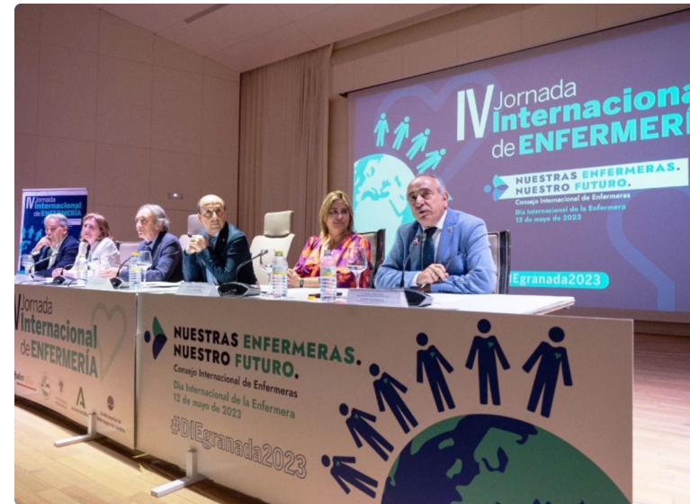
Mesa institucional en la inauguración de la Jornada Internacional de Granada

que “las condiciones de los profesionales que ejercen esta profesión sean dignas para que el cuidado a los pacientes sea el mejor posible. Pertenece a una profesión esencial que ha estado ahí cuando se nos ha necesitado y, sinceramente, no sentimos el apoyo ni el respaldo esperado”, ha señalado la presidenta.