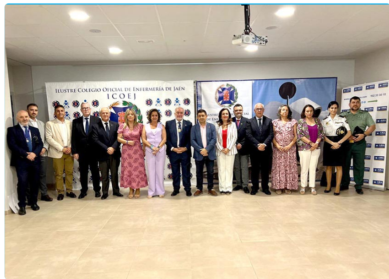
Autoridades junto al presidente y miembros de la Junta de Gobierno del ICOEJ

algunas de las mejoras que llevamos años solicitando, algunas tan peren-