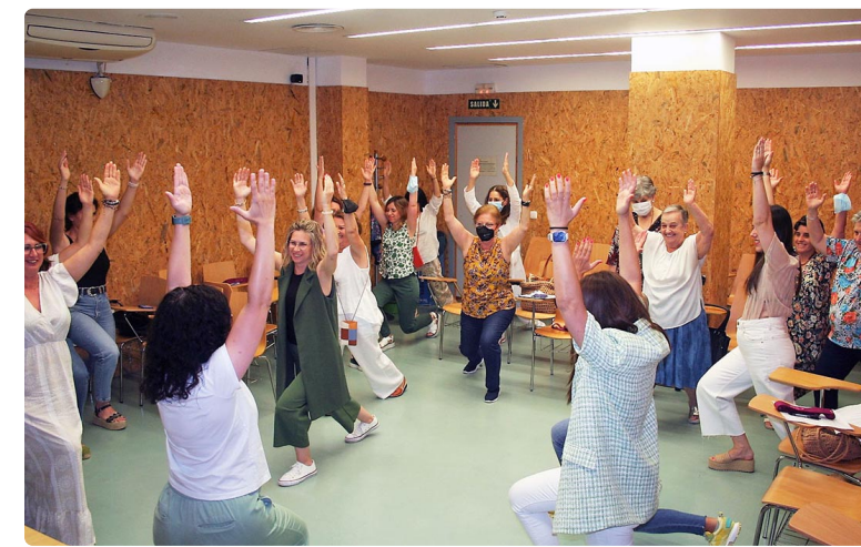
Imagen de uno de los talleres formativos.