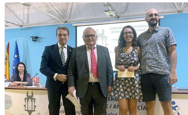
El Colegio de Enfermería de Cádiz patrocinó los dos premios entregados en este Encuentro

Además, durante la jornada del jueves 15 de junio, día previo a la celebración de este Encuentro, la AEESME ofreció, en el salón de actos del Colegio de Enfermería de Cádiz, el curso 'Los cuidados enfermeros desde la terapia grupal', una formación que puso en valor el poder de la dinámica grupal en la acción terapéutica para el abordaje grupal con las personas usuarias de la red de Salud Mental. ■