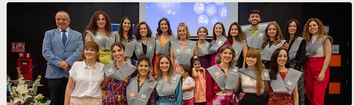
Nuevos especialistas, en un acto de homenaje