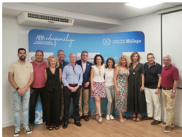
Junta de Gobierno del Colegio de Enfermería de Málaga en la celebración de la Junta General de Colegiados

A continuación, se han resaltado los resultados positivos de la corporación y se han compartido las principales líneas de trabajo llevadas a cabo durante ese periodo, haciendo hincapié en el compromiso de transparencia que mantiene la institución con sus profesionales y la sociedad. Además, se ha puesto en relieve el significativo avance que se ha experimentado en el ámbito de la