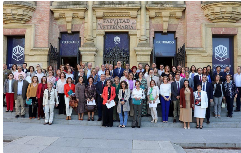
Foto de familia de los asistentes a la celebración del Patrón de la Enfermería, San Juan de Dios, organizada por el Colegio de Córdoba

El Colegio de Enfermería de Córdoba ha resaltado su apuesta por el desarrollo profesional y competencial de la profesión. Además, el Colegio reclama su participación en la Comisión Provincial de Agresiones a profesionales del